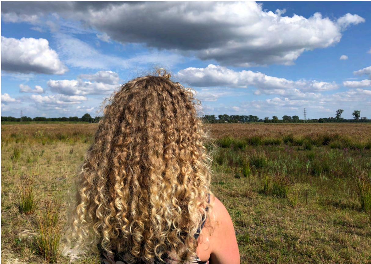
Masterclass deep mapping. Summer school Wild Perspectives, WUR.