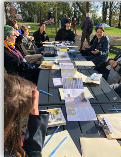
ArtEz, Arnhem, masterclass

Naar buiten toe leek het een rustig en stil jaar. Achter de schermen hield Baaijens zich vooral bezig met studie en research voor het nieuwe project. In november nam Baaijens deel aan Sea Women Expeditions in de Noorse Zee. Contact met publiek verliep voornamelijk via de website Taal voor de toekomst en social media. Daarnaast werd Baaijens regelmatig uitgenodigd om voor studenten en trainees workshops deep mapping te verzorgen, waarbij zichtbare en niet-zichtbare kwaliteit-en van landschap in kaart worden gebracht. Twee stagiaires leverden een stimulerende bijdrage aan het project met de Noordzee.